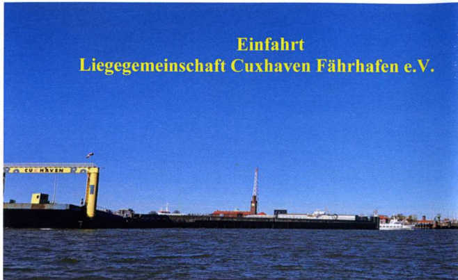
Einfahrt Liegegemeinschaft Cuxhaven Fährhafen e.V.

Von Hamburg kommend, fahren sie direkt in das erste große Hafenbecken.